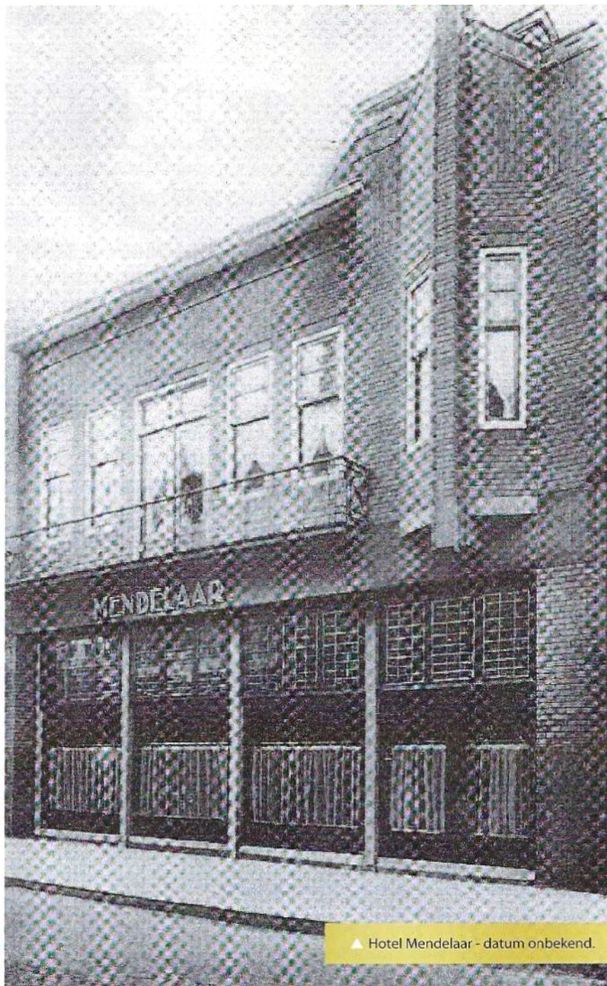
▲ Hotel Mendelaar - datum onbekend.

Een van de spelers is Wim Weerkamp, inmiddels 81 jaar, en hij weet het zich nog goed te herinneren. 'Mendelaar is bij mij wel bekend, ja, ik was zeventien toen ik in het eerste elftal kwam. We hadden daar zaterdags tegen half zes altijd een ontmoeting met het elftal om de strategie te bespreken voor de wedstrijd die we de volgende dag zouden spelen. Het was er altijd buitengewoon gezellig en er werd niet alleen water gedronken. Er tegenover was de cafetaria van Roelofs waar na die tijd de nodige patatjes en andere etenswaren naar binnen werden gewerkt.' Henk Schunselaar is dan een paar jaar jonger, hij schat zelf dat hij vijftien, zestien is. 'Er waren natuurlijk ook oudere mannen bij. Rinus Vergeer had met mijn ouders afgesproken dat hij een beetje op me zou letten. Voor jongens van mijn leeftijd was het vooral gemakkelijk om midden in de binnenstad te zijn, want dat was toch de plek waar je op zaterdagavond wilde zijn. Ik herinner me namen als de gebroeders Wegdam en Roelofs, Jan Beckmann, Henk Krake. Later raakte ik bevriend met Paul Grijpma, die bekend zou worden van het NOS Journaal, »