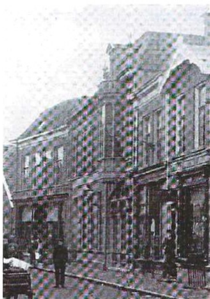
▲ Hotel Mendelaar 1910.